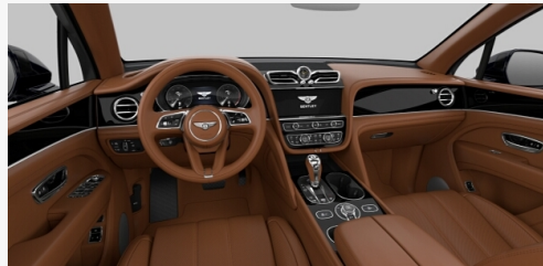
COLOUR SPLIT INTERIOR COLOUR SPLIT - D