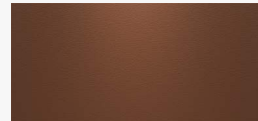
SECONDARY HIDE SADDLE