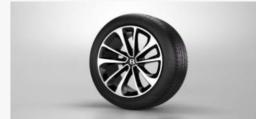
WHEELS 21" FIVE TWIN-SPOKE WHEEL - BLACK PAINTED AND BRIGHT MACHINED