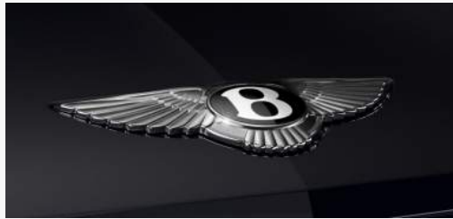
PAINTS DARK SAPPHIRE