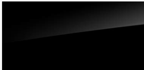
VENEER PIANO BLACK